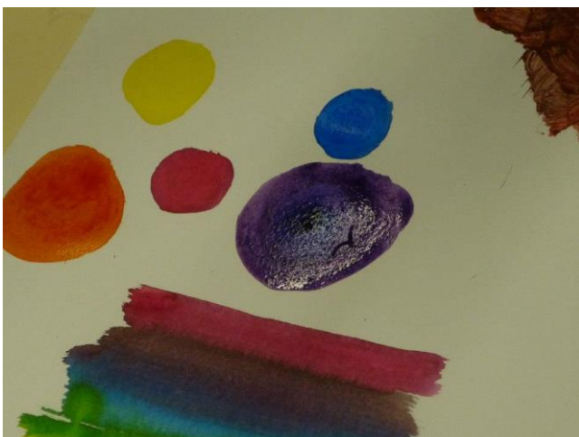
Aula prática sobre imagem e cor